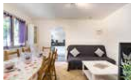
Gite du GR5, appartement 4 chambres doubles et 3 salles d'eau avec cuisine équipée et salle à manger 12 personnes