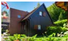
Chalet groupe 4 chambres avec grande salle à manger pour 20 personnes et 10 couchages