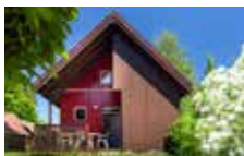
Chalet 4 personnes classique 2 chambres 30 m 2