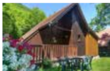
Chalet 5 personnes confort 3 chambres 35 m 2