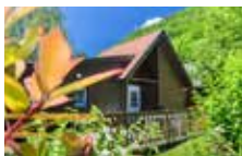
Chalet 4 personnes confort 2 chambres 35 m 2