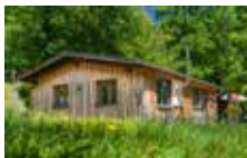
Chalet Ours 2 personnes 1 chambre 40 m 2