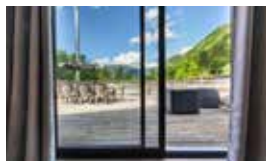
Gite du Hohneck, appartement 3 chambres doubles et 2 salles d'eau avec cuisine équipée et salle à manger 12 personnes

Disponibilités et tarifs sur notre site internet www.alsace-chalets.fr