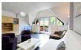
Gite Wormsa, appartement 3 chambres doubles et 2 salles d'eau avec cuisine équipée et salle à manger 8 personnes