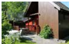
Chalet adapté aux personnes en fauteuils roulants 4 pers.