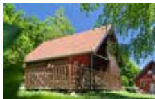
Chalet 6 personnes 3 chambres 42 m 2