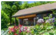
Chalet 2 personnes 1 chambre 25 m 2