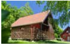
Chalet 6 Personen 3 Schlafzimmer 42 m²

Gruppe Chalet mit 4 Schlafzimmer, Esszimmer bis 20 Personen und 10 Personen schlafen