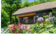
Chalet 2 Personen 1 Schlafzimmer 25 m²