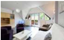
Gite Wormsa, Wohnung mit 3 Doppelzimmer, 2 Badezimmer, Einbauküche und Esszimmer für 8 Personen