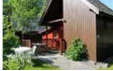
Chalet für rollstuhl eingerrichtet 4 Personen