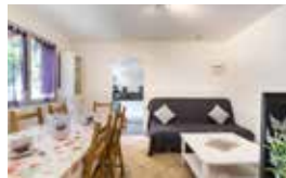
Gite du GR5, Wohnung mit 4 Doppelzimmer, 3 Badezimmer, Einbauküche und Esszimmer für 12 Personen