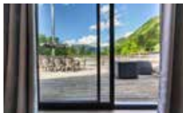
Gite du Hohneck, Wohnung mit 3 Doppelzimmer, 2 Badezimmer, Einbauküche und Esszimmer für 12 Personen

Verfügbarkeit und Preise auf unserer Website www.alsace-chalets.fr/de