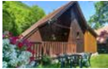
Chalet 5 Personen Komfort 3 Schlafzimmer 35 m²