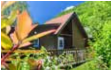
Chalet 4 Personen Komfort 2 Schlafzimmer 35 m²