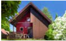
Chalet 4 Personen Klassisch 2 Schlafzimmer 30 m²