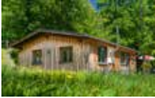
Chalet Ours 2 Personen 1 Schlafzimmer 40 m²